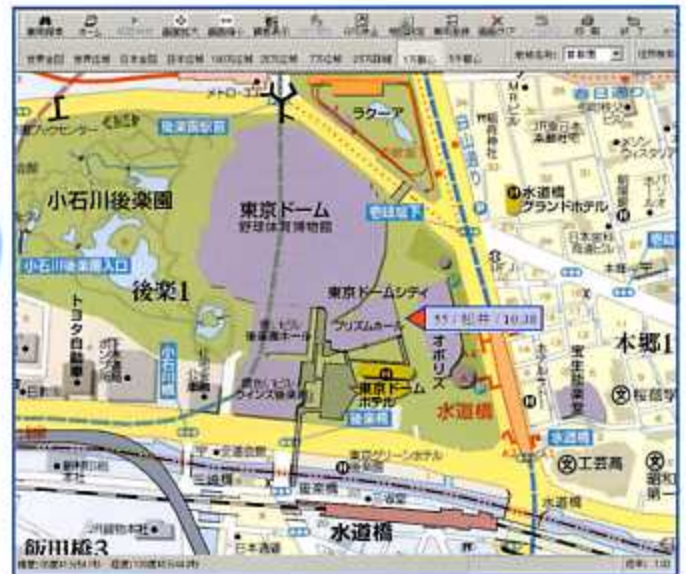
(地図縮尺1/10000での画面表示例)