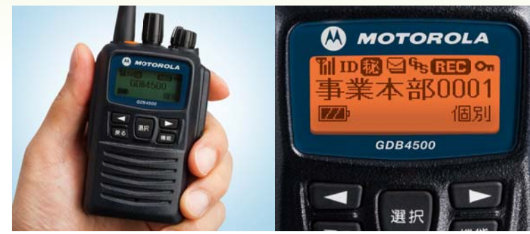
ディスプレイ: 実物大(バックライト点灯時)

大切な用件を録音する音声メモ機能とリピート再生* 残したい用件をすばやく録音できる便利な音声メモ機能は、後で繰り返し内容を確認することができます。直近の受信音声は常に保存され、応答できない場合でもリピート再生が可能です。